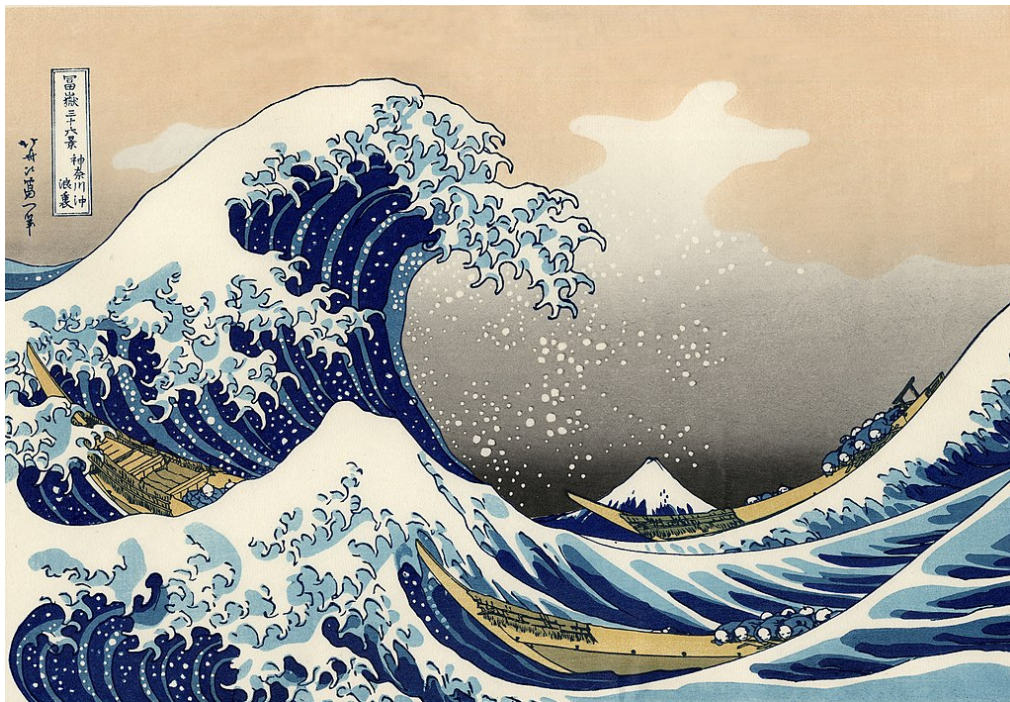
Figure 3.1: great wave

Lorem ipsum dolor sit amet, consectetur adipiscing elit. Phasellus neque ex, vehicula dictum risus fermentum, feugiat faucibus neque. Etiam purus quam, lacinia vel porta in, malesuada ac nisl. Vestibulum ante ipsum primis in faucibus orci luctus et ultrices posuere cubilia curae; Sed bibendum placerat tellus, ac finibus lectus euismod eget. Nulla mattis diam vitae bibendum consequat.